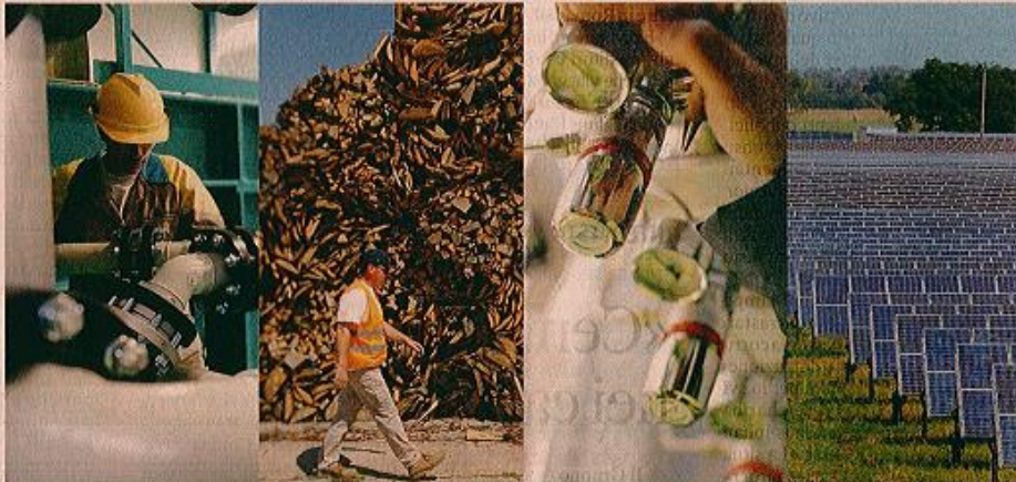
Il Gruppo Siram offre soluzioni tecnologicamente avanzate per rispondere alle esigenze di efficienza energetica di Enti pubblici e imprese

Società integrata al 100% nel Gruppo Veolia dal luglio 2014, Siram sta attuando il Piano di trasformazione e sviluppo 2015-2018 presentandosi oggi ai suoi stakeholder con una struttura semplificata ed efficiente, un'offerta tecnologicamente all'avanguardia e una situazione finanziaria sana e solida: l'anno fiscale 2015 si è chiuso in forte crescita, con un significativo aumento dell'Ebitda e un debito che è stato dimezzato in due anni. Il Gruppo vanta oggi un portafoglio di 3,4 miliardi di Euro e già nei primi mesi 2016 ha riportato importanti successi di business nel settore pubblico e